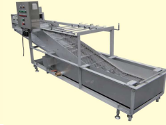
40 塩水漬けネットコンベア Netlike Conveyor