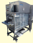
64 立体型万能水圧ウロコ取り機 3D Auto Scaler