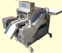
58 ワカメ・コンブ刻み機 Chopper for Seaweed