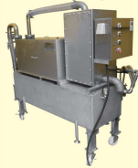
43 バキューム式内臓取り機 Vacuum Gutting Machine