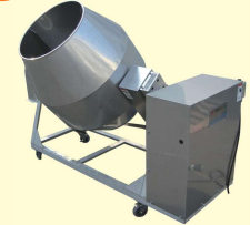
56 ツボ型 ミキサー各種 Mixer