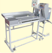
36 小型バケツ式ヘッドカッター Heading Machine for small size fish