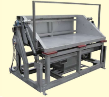
42 反転機 Feeder