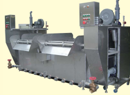
44 解冻機 De-Frost Machine