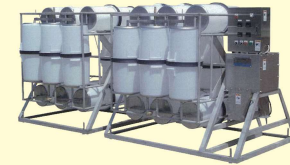
49 白樽回転機 Pollack Roe Mixer