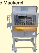
48 アジゼイゴ取り機 Auto Scaler for Hard Scales of Horse Mackerel