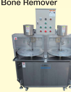
55 タイフィーレ腹骨すき機 Sea Bream Abdominal Bone Remover