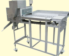
37 中型バケツ式ヘッドカッター Heading Machine