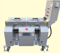
52 斜めスライサー ダブル型 SASHIMI Slicer Double Type