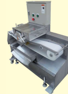
46 連続式スキナー Fish Skinner for Horse Mackerel