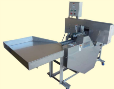
57 クキ細切り機 Fine Cutter for Seaweed