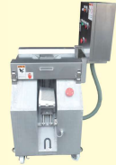
51 斜めスライサー シングル型 SASHIMI Slicer Single Type