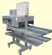
65 サーモン用ピンボーン抜き機 Auto Pin-Bone Remover