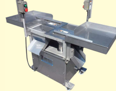
67 ヒレ切り機 Fin Cutter