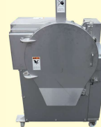
60 メカブスライサー Multi-Slicer