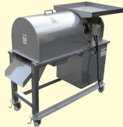
50 バラコ採取機 Roe Membrane Remover