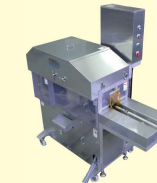
62 サーモンメフン洗浄機 Salmon Blood Line Cleaner