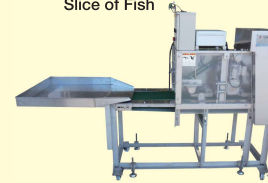
54 ロインカット機 Machine for Producing Slice of Fish