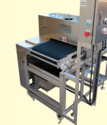
69 魚類骨切り機 Fillet Slitter