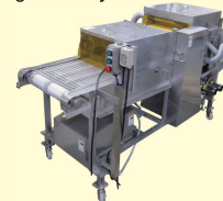
61 フィール洗浄脱水機 Rising and Dehydrator for Fillets