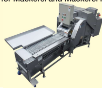
38 サバ・サンマ引き抜き式ヘッドカッター Heading and Gutting Machine for Mackerel and Mackerel Pike