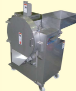
59 メカブ角切りスライサー Seaweed Dice Cutter