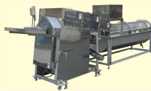
39 ホタテヒモ取り機・ワタ取り機 TT-15・30・45 Scallop Mount Remover TT-15・30・45