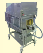
63 ハマチ・サーモンウロコ取り・血合い洗浄機 Auto Scaler & Blood Line Cleaner