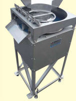
45 整列機 Alignment Machine